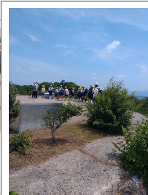
助け合ってゴールのナ ガレ山古墳の頂上まで 上りました