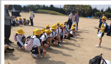
今日の活動の約束をみんな で確認します

本校は、全体として児童数が少ないことから、異年齢集団による縦割り活動を通じて、望ましい人間関係及び社会性を育むとともに、集団内での役割を果たす経験を通じて自尊感情や自己有用感を育む取組を大切にしています。この日は、縦割り班による全校遠足を実施しました。各々、その学年らしさを発揮しながら、支え合い、協力し合って、午前のオリエンテーリング、午後の集団遊びを楽しみました。時に六年生の活躍は素晴らしく、東小で育った子はどの子どももこのように成長するのだなあと感慨深く、この活動を大切にしていきたいと思いました。