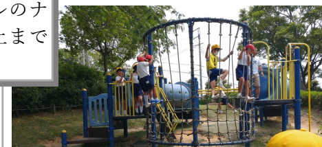
フリスビードッジも遊具遊びも満喫 しました