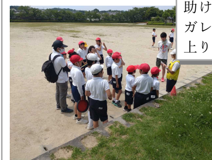
遊ぶ前にも6年生の説明をよく 聞いて・・・